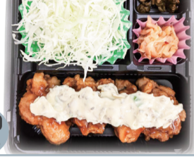
下町ホリちゃん チキン南蛮