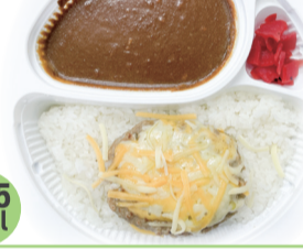
チーズハンバーグ カレー