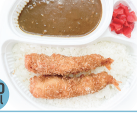
海老フライカレー