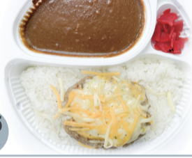
チーズハンバーグ カレー