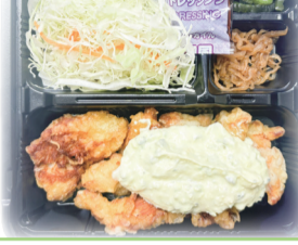
鶏むね肉 チキン南蛮