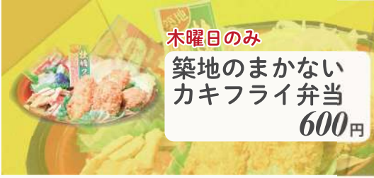
木曜日のみ 築地のまかないカキフライ弁当 600円