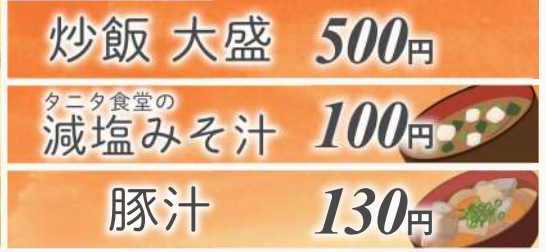
炒飯 大盛 500円