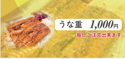
うな重 1,000円 毎日ご注文出来ます